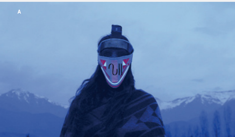
A. Fotograma de "Los ojos serán lo último en pixelarse", 2016, Galería Patricia Ready. Foto cortesía de la artista. B, C y D. "Los ojos serán lo último en pixelarse", 2016, Galería Patricia Ready. Foto cortesía de la artista.